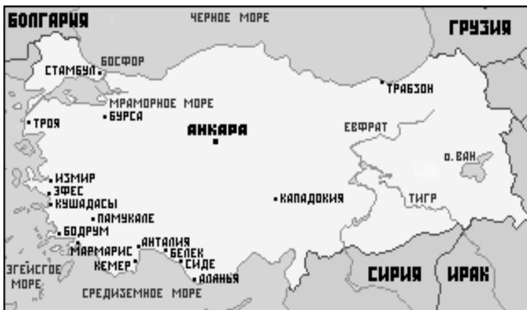
Рис.4. Основные туристские центры Турции